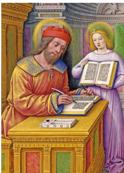
Miniatura de sant Mateu de les Grandes Heures d'Anne de Bretagne (1503-1508) . Biblioteca Nacional de París (França)

C omencem avui un nou cicle de catequesis: la passió per l'evangelització, és a dir, el zel apostòlic. Es tracta d'una dimensió vital per a l'Església: la comunitat dels deixebles de Jesús de fet neix apostòlica, neix missionera, no proselitista. I avui voldria començar amb un episodi evangèlic: la crida de l'apòstol Mateu (cf. Mt 9,9-13).