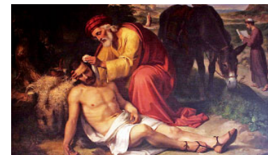
El bon samarità (1838), de Pelegrí Clavé. Reial Acadèmia Catalana de Belles Arts de Sant Jordi (Barcelona)