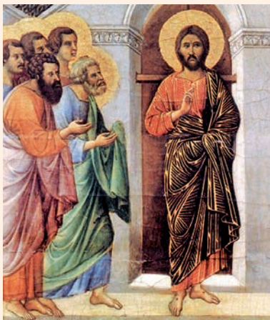
Aparició de Jesús ressuscitat als Apòstols. Panell de la Maestà de Duccio, Catedral de Siena

En paz me acuesto y en seguida me duermo, / porque tú solo, Señor, me haces vivir tranquilo. R.