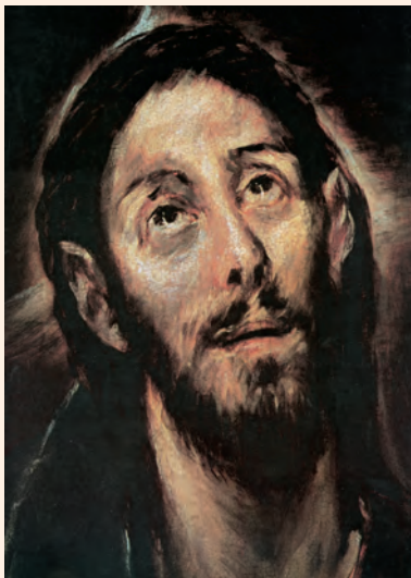
El Salvador (fragment), pintura d'El Greco, Ciutat del Vaticà

Se levantó de madrugada, se marchó al descampado y allí se puso a orar. Simón y sus compañeros fueron y, al encontrarlo, le dijeron: «Todo el mundo te busca.» Él les respondió: «Vámonos a otra parte, a las aldeas cercanas, para predicar también allí; que para eso he salido.» Así recorrió toda Galilea, predicando en las sinagogas y expulsando los demonios.