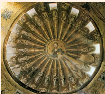
Tots els temps convergeixen en Crist. Cúpula de la famosa Kariye Djami d'Is-tanbul (Turquia)

Que la vostra mà reposti / sobre l'home que serà el vostre braç dret, / el fill de l'home a qui vos doneu la força. / No ens apartarem mai més de vos; / guardeu-nos vos la vida / perquè invoquem el vostre nom. R.