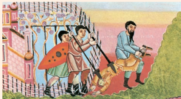
Paràbola dels vinyaters homicides. Evangeliari d'Echternach, Museu Nacional de Nüremberg

En aquel tiempo, dijo Jesús a los sumos sacerdotes y a los senadores del pueblo: «Escuchad otra paràbola: Había un propietario que plantó una viña, la rodeó con una cerca, cavó en ella un lagar, construyó la casa del guarda, la arrendó a unos labradores y se marchó de viaje. Llegado el tiempo de la vendimia, envió sus criados a los labradores, para percibir los frutos que le correspondían. Pero los labradores, agarrando a los criados, apalearon a uno, mataron a otro, y a otro lo apedrearon. Envío de nuevo otros criados, más que la primera vez, e hicieron con ellos lo mismo. Por último les mandó a su hijo, diciéndose: «Tendrán respeto a mi hijo.» Pero los labradores, al ver al hijo, se dijeron: «Este es el heredero: venid, lo matamos y nos quedamos con su herencia.» Y, agarrándolo, lo empujaron fuera de la viña y lo mataron. Y ahora, cuando vuelva el dueño de la viña, ¿qué hará con aquellos labradores?» Le contestaron: «Hará morir de mala muerte a esos malvados y arrendará la viña a otros labradores, que le entreguen los frutos a sus tiempos.» Y Jesús les dice: «¿No habéis leído nunca en la Escritura: «La piedra que desecharon los arquitectos es ahora la piedra angular. Es el Señor quien lo ha hecho, ha sido un milagro patente»? Por eso os digo que se os quitará a vosotros el reino de Dios y se dará a un pueblo que produzca sus frutos.»