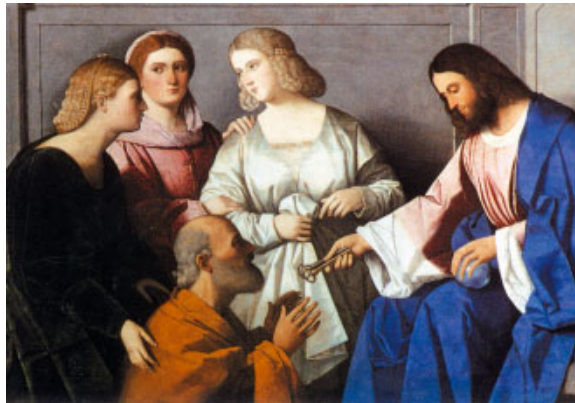
Jesús lliura les claus a sant Pere, pintura de Vincenzo di Biagio Catena (c. 1470-1531)

El Señor es sublime, se fija en el humilde, / y de lejos conoce al soberbio. / Señor, tu misericordia es eterna, / no abandones la obra de tus manos. R.