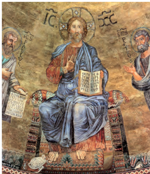
Crist Rei. Basilica de Sant Pau Extramurs (Roma)

«Mi reino no es de este mundo. Si mi reino fuera de este mundo, mi guardia habría luchado para que no cayera en manos de los judíos. Pero mi reino no es de aquí.» Pilato le dijo: «Conque, ¿tú eres rey?» Jesús le contestó: «Tú lo dices: soy rey. Yo para esto he nacido y para esto he venido al mundo; para ser testigo de la verdad. Todo el que es de la verdad escucha mi voz.»