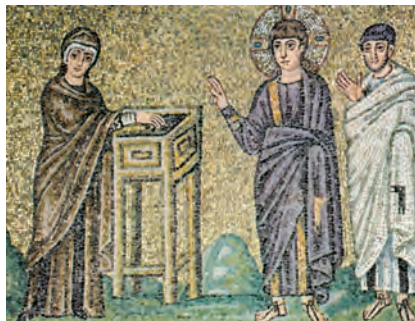
Jesús i l'òbol de la viuda. Mosaic de Sant Apol·linar (s. vi), Ravenna (Itàlia)

Manté les viudes i els orfes, / i capgira els camins dels injustos. / El Senyor regna per sempre, / és el teu Déu, Sió, per tots els segles. R.