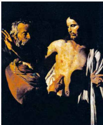
Incredulitat de sant Tomàs. Pintura de Matthias Stomer (1600-1650), Museu del Prado (Madrid)

Muchos otros signos, que no están escritos en este libro, hizo Jesús a la vista de los discípulos. Estos se han escrito para que creáis que Jesús es el Mesías, el Hijo de Dios, y para que, creyendo, tengáis vida en su nombre.