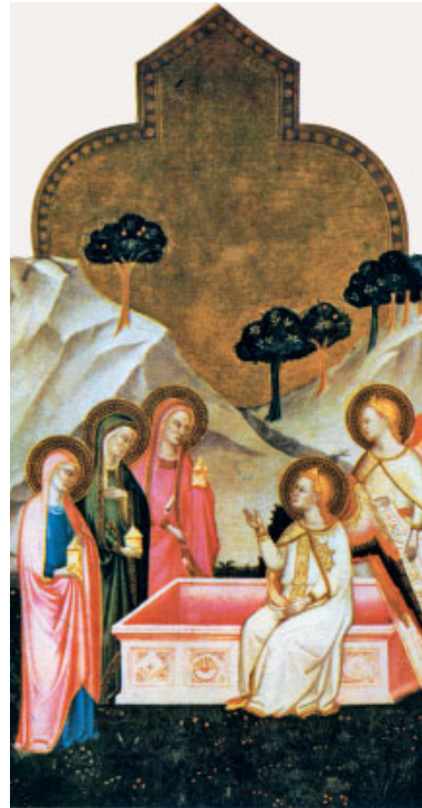
Diàleg davant el sepulcre buit dels àngels i les dones. Pintura de l'escola italiana d'Oragna (s. xiv), National Gallery (Londres)

Entonces entró también el otro discípulo, el que había llegado primero al sepulcro; vio y creyó. Pues hasta entonces no habían entendido la Escritura: que él había de resucitar de entre los muertos.