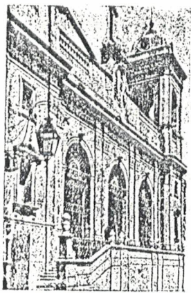
La Catedral de Lérida

859. A principios de Octubre del año 1839, deseoso de dedicarse a las misiones extranjeras, se fue a Roma, donde permaneció hasta mediados de Marzo del año siguiente, en que por motivo de las muchas lluvias y humedades le sobrevino un dolor reumático, para cuyo remedio le aconsejaron los médicos que regresara a España.