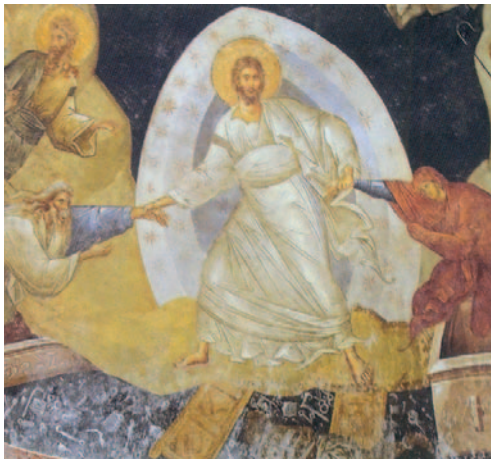
Crist ressuscitat dona la mà a Adam i Eva. És la solidaritat del Crist victoriós de la mort amb tota la humanitat. Església de Sant Salvador, Chora, Istanbul

El primer día de la semana, María Magdalena fue al sepulcro al amanecer, cuando aún estaba oscuro, y vio la losa quitada del sepulcro. Echó a correr y fue donde estaba Simón Pedro y el otro discípulo, a quien tanto quería Jesús, y les dijo: «Se han llevado del sepulcro al Señor y no sabemos dónde lo han puesto.» Salieron Pedro y el otro discípulo camino del sepulcro. Los dos corrían juntos, pero el otro discípulo corría más que Pedro; se adelantó y llegó primero al sepulcro; y, asomándose, vio las vendas en el suelo; pero no entró. Llegó también Simón Pedro detrás de él y entró en el sepulcro: vio las vendas en el suelo y el sudario con que le habían cubierto la cabeza, no por el suelo con las vendas, sino enrollado en un sitio aparte. Entonces entró también el otro discípulo, el que había llegado primero al sepulcro; vio y creyó. Pues hasta entonces no habían entendido la Escritura: que él había de resucitar de entre los muertos.