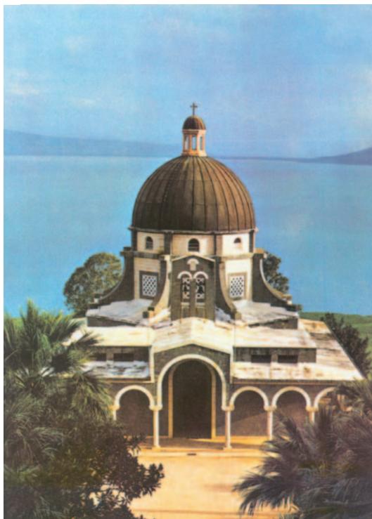
Església situada tocant al llac de Tiberiades, que recorda el lloc del Sermó de la Muntanya

Pero, ¡ay de vosotros, los ricos, porque ya tenéis vuestro consuelo! ¡Ay de vosotros, los que ahora estáis saciados, porque tendréis hambre! ¡Ay de los que ahora reís, porque haréis duelo y lloraréis! ¡Ay si todo el mundo habla bien de vosotros! Eso es lo que hacían vuestros padres con los falsos profetas.»