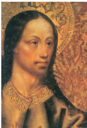
Faz de Jesucrist, pintura de l'anomenat Mestre de Robredo (s. xv), Museu del Prado, Madrid

Al oír esto, todos en la sinagoga se pusieron furiosos y, levantándose, lo empujaron fuera del pueblo hasta un barranco del monte en donde se alzaba su pueblo, con intención de despeñarlo. Pero Jesús se abrió paso entre ellos y se alejaba.