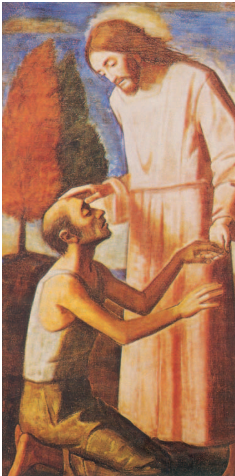
Jesús guareix un cec. Pintura de Luigi Filocamo, Museu d'Art Modern. Ciutat del Vaticà

Tampoco Cristo se confirió a sí mismo la dignidad de sumo sacerdote, sino aquel que le dijo: «Tú eres mi Hijo: yo te he engendrado hoy», o, como dice otro pasaje de la Escritura: «Tú eres sacerdote eterno, según el rito de Melquisedec.»