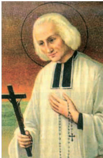
Sant Joan Maria Vianney

No desconeixem defectes i fragilitats en capellans i bisbes, però haurem de reconèixer amb admiració i agraïment els esforços apostòlics de la immensa majoria d'ells, el servei infatigable i amagat i els mil actes d'aquella caritat que no exclou ningú. Donem gràcies per la fidelitat entusiasta de tants d'ells que, malgrat les dificultats i incomprensions, perseveren en la seva vocació d'«amics del Crist», cridats personalment, elegits i enviats per Ell. Segur que tots hem conegut algun mossèn que portem al cor de manera especialíssima i que ha estat per a nosaltres un exemple d'entrega sense reserves, ben compromès molt generosament en l'exercici ordinari del seu ministeri.