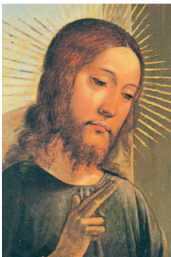
Rostre del Crist, del Tríptic de la Santa Cena. Sagristia de la catedral de Toledo.

Y, si tu pie te hace caer, córtatelo: más te vale entrar cojo en la vida, que ser echado con los dos pies al infierno. Y, si tu ojo te hace caer, sácatelo: más te vale entrar tuerto en el reino de Dios, que ser echado con los dos ojos al infierno, donde el gusano no muere y el fuego no se apaga.»