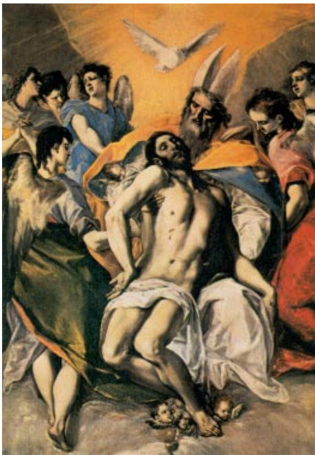
Santísima Trinitat. Retaule de Santo Domingo el Antiguo, Toledo. (Museu del Prado), Madrid

Moisés habló al pueblo, diciendo: «Pregunta, pregunta a los tiempos antiguos, que te han precedido, desde el día en que Dios creó al hombre sobre la tierra: ¿hubo jamás, desde un extremo al otro del cielo, palabra tan grande como ésta?; ¿se oyó cosa semejante?; ¿hay algún pueblo que haya oído, como tú has oído, la voz del Dios vivo, hablando desde el fuego, y haya sobrevivido?; ¿algún Dios intentó jamás venir a buscarse una nación entre las otras por medio de pruebas, signos, prodigios y guerra, con mano fuerte y brazo poderoso, por grandes terrores, como todo lo que el Señor, vuestro Dios, hizo con vosotros en Egipto, ante vuestros ojos? Reconoce, pues, hoy y medita en tu corazón, que el Señor es el único Dios, allá arriba en el cielo, y aquí abajo en la tierra; no hay otro. Guarda los preceptos y mandamientos que yo te prescribo hoy, para que seas feliz, tú y tus hijos después de ti, y prolongues tus días en el suelo que el Señor, tu Dios, te da para siempre».