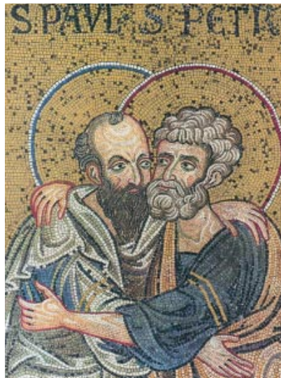
Sant Pere i Sant Pau s'abracen. Mosaic de la Catedral de Monreale (s. XII). Palerm (Itàlia)

En aquel tiempo, dijo Jesús a sus discípulos: «Yo soy la verdadera vid, y mi Padre es el labrador. A todo sarmiento mío que no da fruto lo arranca, y a todo el que da fruto lo poda, para que dé más fruto. Vosotros ya estáis limpios por las palabras que os he hablado; permaneced en mí, y yo en vosotros. Como el sarmiento no puede dar fruto por sí, si no permanece en la vid, así tampoco vosotros, si no permanecéis en mí. Yo soy la vid, vosotros los sarmientos; el que permanece en mí y yo en él, ése da fruto abundante; porque sin mí no podéis hacer nada. Al que no permanece en mí lo tiran fuera, como el sarmiento, y se seca; luego los recogen y los echan al fuego, y arden. Si permanecéis en mí, y mis palabras permanecen en vosotros, pedid lo que deseáis, y se realizará. Con esto recibe gloria mi Padre, con que deis fruto abundante; así seréis discípulos míos.»