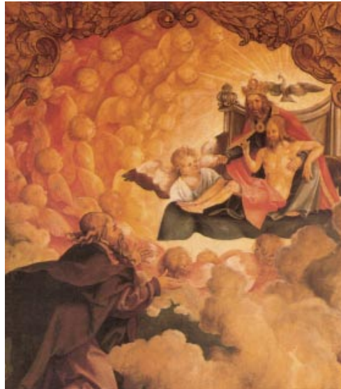
Sant Pau diu d'ell mateix que «va ser endut fins al tercer cel i va sentir-hi paraules inefables que als humans no és permès de repetir» (2Co 12,1-4). (Quadre de Kulmbach. Galleria degli Uffizi, Florència)

Beneït el qui ve en nom del Senyor. / Us beneïm des de la casa del Senyor. / Vós sou el meu Déu, us dono gràcies, / us exalço, Déu meu! / Enaltiu el Senyor: Que n'és de bo! / Perdura eternament el seu amor. R.