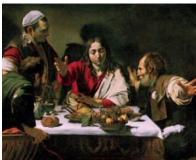
Els deixebles d'Emaús. (Michelangelo Merisi da Caravaggio)

Avui hi ha massa actituds depressives entre cristians, com les d'aquells deixebles d'Emaús (Lc 24) que «marxaven» tristos i perduts, profundament desil·lusionats després de compartir el projecte de Jesús (deien: «Nosaltres esperàvem...» v. 21). Hi ha massa gent vacil·lant a la que haurem d'alimentar amb la Paraula salvadora, ocasional o sistemàticament, i els cansaments dels quals haurem de sostenir amb experiències «eucarístiques» perquè torni a «abrusar-se el seu cor».