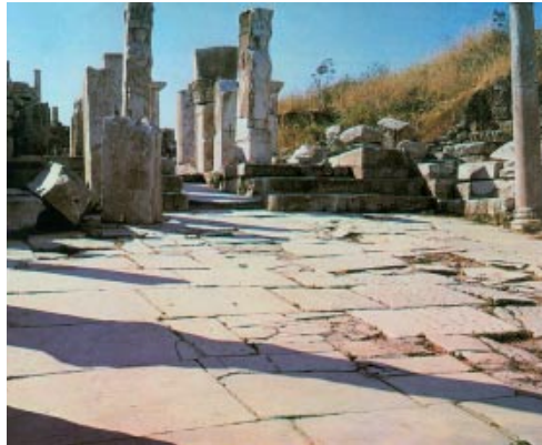
Avui, a la litúrgia de la Paraula, llegim un fragment de la carta de sant Pau als efesis. Gravats: ruïnes d'un dels carrers de la ciutat d'Efes, que condueix a l'àgora alta

En aquellos días, todos los jefes de los sacerdotes y el pueblo multiplicaron sus infidelidades, según las costumbres abominables de los gentiles, y mancharon la casa del Señor, que él se había construido en Jerusalén. El Señor, Dios de sus padres, les envió desde el principio avisos por medio de sus mensajeros, porque tenía compasión de su pueblo y de su morada. Pero ellos se burlaron de los mensajeros de Dios, despreciaron sus palabras y se mofaron de sus profetas, hasta que subió la ira del Señor contra su pueblo a tal punto que ya no hubo remedio. Los caldeos incendiaron la casa de Dios y derribaron las murallas de Jerusalén; pegaron fuego a todos sus palacios y destruyeron todos sus objetos preciosos. Y a los que escaparon de la espada los llevaron cautivos a Babilonia, donde fueron esclavos del rey y de sus hijos hasta la llegada del reino de los persas; para que se cumpliera lo que dijo Dios por boca del profeta Jeremías: «Hasta que el país haya pagado sus sábados, descansará todos los días de la desolación, hasta que se cumplan los setenta años.»