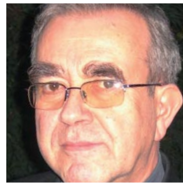
▶ VALENTÍ MISERACHS