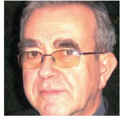
▶ VALENTÍ MISERACHS