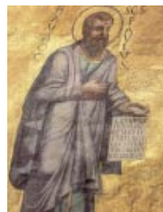
Mosaico del ábside de la Basílica de San Pablo Extramuros, Roma

El viatge de Cesarea a Roma fue una epopeya, contada (casi: «cantada») por Lucas en los últimos capítulos de los Hechos. En Roma se le concedió la situación más favorable: una casa alquilada, con un guardia a la puerta, donde Pablo podía recibir incluso