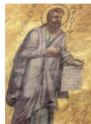
Mosaico del ábside de la Basílica de San Pablo Extramuros, Roma

En el centro del mundo mediterráneo, con un puerto importante a cada lado del istmo, Corinto era una capital económica en tiempo de Pablo: mucha inmigración, mucho dinero e, inevitablemente, mucho vicio. Por otro lado, estaban más abiertos al bagaje espiritual que podían transportar unos u otros viajeros. Pablo estuvo allí más tiempo que en otras partes (sólo en Éfeso estuvo más) y reunió una comunidad considerable, con más pobres que ricos, más ignorantes que sabios y más gente humilde que poderosa, fruto normal de una predicación abierta.