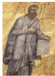
Mosaico del ábside de la Basílica de San Pablo Extramuros, Roma

Hoy día se viaja del norte al Sur de Grecia bordeando el Monte Olimpo y recordando el paso de las Termópilas. En tiempo de Pablo era mejor ir por mar. Por mar se atrevió el apóstol a llegar solo hasta Atenas, lo cual hizo más fuerte el impacto de un paganismo todavía muy vivo, expresado en monumentos de belleza apabullante.