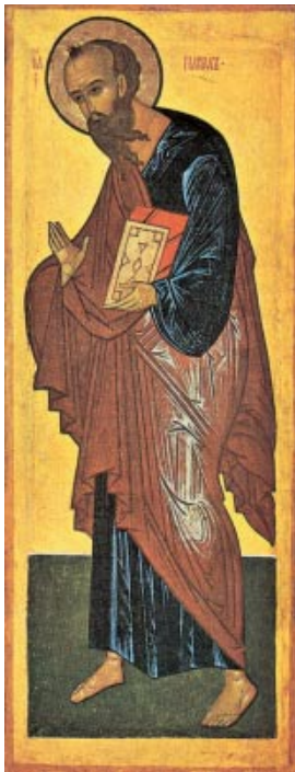
Sant Pau. Icona del s. xv. Museu rus. Sant Petersburg

Y la Palabra se hizo carne y acampó entre nosotros, y hemos contemplado su gloria: gloria propia del Hijo único del Padre, lleno de gracia y de verdad. Juan da testimonio de él y grita diciendo: «Éste es de quien dije: "El que viene detrás de mí pasa delante de mí, porque existía antes que yo".» Pues de su plenitud todos hemos recibido, gracia tras gracia. Porque la Ley se dio por medio de Moisès, la gracia y la verdad vinieron por medio de Jesucristo. A Dios nadie lo ha visto jamás: Dios Hijo único, que está en el seno del Padre, es quien lo ha dado a conocer.