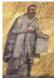
Mosaico del ábside de la Basilica de San Pablo Extramuros, Roma

A l poco tiempo, Pedro fue a Antioquia «como Pedro por su casa»: era una manera de mantener las nuevas ramas unidas al tronco del judeocristianismo. Habló con todos y comió con todos, a pesar de que la Ley de Moisés es muy estricta en temas de comida. Además,