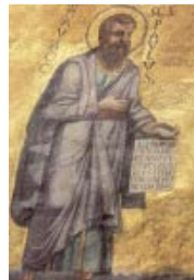
Mosaico del ábside de la Basilica de San Pablo Extramuros, Roma

Antioquía també se encuentra en el ángulo nordeste del Mediterráneo, pero en la pared asiática. Era una gran capital, a la cual llegaron cristianos de lengua griega, compañeros de aquel Esteban que había sido lapidado por su polémica sobre la Ley, que Cristo reformaba, y sobre el Templo, que Cristo sustituía por un Templo espiritual.