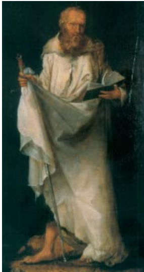
Sant Pau. Anònim holandès del cercle de L. van Leyden (s. xvi). Museu Thyssen-Bornemisza (Madrid)

Finalmente, se acercó el que había recibido un talento y dijo: «Señor, sabía que eres exigente, que siegas donde no siembras y recoges donde no esparces; tuve miedo y fui a esconder mi talento bajo tierra. Aquí tienes lo tuyo.» El señor le respondió: «Eres un empleado negligente y holgazán. ¿Conque sabías que siego donde no siembro y recojo donde no esparzo? Pues debías haber puesto mi dinero en el banco, para que, al volver yo, pudiera recoger lo mío con los intereses. Quitadle el talento y dáselo al que tiene diez. Porque al que tiene se le dará y le sobraré, pero al que no tiene, se le quitará hasta lo que tiene. Y a ese empleado inútil echadlo fuera, a las tinieblas; allí será el llanto y el rechinar de dientes.»»