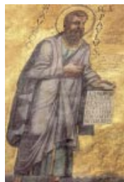
Mosaico del ábside de la Basílica de San Pablo Extramuros, Roma

Es difícil calcular en qué año nació el apóstol de las gentes. Sabemos sólo que en aquella época, en cuanto a capacidad emprendedora, no había jóvenes de sesenta años y apenas de cincuenta. Sabemos, por otro lado, que entre el 57 y el 58, en su Carta a los Romanos, el apóstol proyecta la evangelización de España en cuanto vuelva de Jerusalén. Calcular que en aquel momento tenía cincuenta años es casi pasarse de generoso.