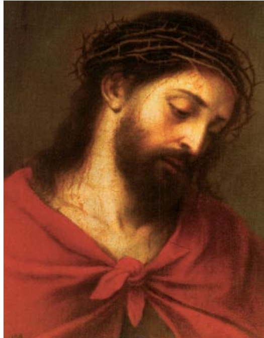
Ecce homo. Pintura de Bartolomé Esteban Murillo (1618-1682). Museu del Prado, Madrid

En aquel tiempo, empezó Jesús a explicar a sus discípulos que tenía que ir a Jerusalén y padecer allí mucho por parte de los ancianos, sumos sacerdotes y escribas, y que tenía que ser ejecutado y resucitar al tercer día. Pedro se lo llevó aparte y se puso a increparlo: «¡No lo permita Dios, Señor! Eso no puede pasarte.» Jesús se volvió y dijo a Pedro: «Quítate de mi vista, Satanás, que me haces tropezar; tú piensas como los hombres, no como Dios.» Entonces dijo a sus discípulos: «El que quiera venir conmigo, que se niegue a sí mismo, que cargue con su cruz y me siga. Si uno quiere salvar su vida, la perderá; pero el que la pierda por mí la encontrará. ¿De qué le sirve a un hombre ganar el mundo entero, si arruina su vida? ¿O qué podrá dar para recobrarla? Porque el Hijo del hombre vendrá entre sus ángeles, con la gloria de su Padre, y entonces pagará a cada uno según su conducta».