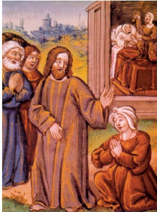
Guarició de la filla de la cananea. Evangeliari de Sant Mateu. Biblioteca Nacional, Madrid

En aquel tiempo, Jesús salió y se retiró al país de Tiro y Sidón. Entonces una mujer cananea, saliendo de uno de aquellos lugares, se puso a gritarle: «Ten compasión de mí, Señor Hijo de David. Mi hija tiene un demonio muy malo.» Él no le respondió nada. Entonces los discípulos se le acercaron a decirle: «Atiéndela, que viene detrás gritando.» Él les contestó: «Sólo me han enviado a las ovejas descarriadas de Israel.» Ella los alcanzó y se postró ante él, y le pidió de rodillas: «Señor, socórreme.» Él le contestó: «No está bien echar a los perros el pan de los hijos.» Pero ella repuso: «Tienes razón, Señor; pero también los perros comen las migajas que caen de la mesa de los amos.» Jesús le respondió: «Mujer, qué grande es tu fe: que se cumpla lo que deseas.» En aquel momento quedó curada su hija.