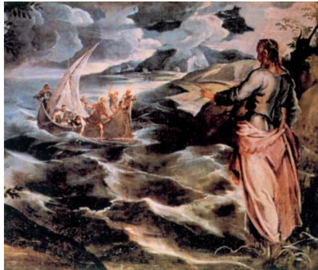
Jesús mana a Pere que vagi cap a ell caminant sobre l'aigua. Pintura de Tintoretto (1518-1594). National Gallery, Washington

El Senyor donarà la pluja, / i la nostra terra donarà el seu fruit. / La bondat anirà al seu davant, / i la pau li seguirà les petjades. R.