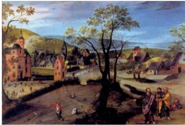
Paràbola del sembrador. Abel Grimmer (d. 1570-c. 1619). Museu del Prado (Madrid)

Aquel día, salió Jesús de casa y se sentó junto al lago. Y acudió a él tanta gente que tuvo que subirse a una barca; se sentó, y la gente se quedó de pie en la orilla. Les habló mucho rato en parábolas: «Salió el sembrador a sembrar. Al sembrar, un poco cayó al borde del camino; vinieron los pájaros y se lo comieron. Otro poco cayó en terreno pedregoso, donde apenas tenía tierra, y, como la tierra no era profunda, brotó enseguida; pero, en cuanto salió el sol, se abrasó y por falta de raíz se secó. Otro poco cayó entre zarzas, que crecieron y lo ahogaron. El resto cayó en tierra buena y dio grano: unos, ciento; otros, sesenta; otros, treinta. El que tenga oídos que oiga.»