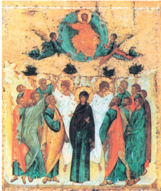
Ascensió del Senyor a la glòria. Icona del segle xv (Moscou)

En aquel tiempo, los once discípulos se fueron a Galilea, al monte que Jesús les había indicado. Al verlo, ellos se postraron, pero algunos vacilaban. Acercándose a ellos, Jesús les dijo: «Se me ha dado pleno poder en el cielo y en la tierra. Id y haced discípulos de todos los pueblos, bautizándolos en el nombre del Padre y del Hijo y del Espíritu Santo; y enseñándoles a guardar todo lo que os he mandado. Y sabed que yo estoy con vosotros todos los días, hasta el fin del mundo.»