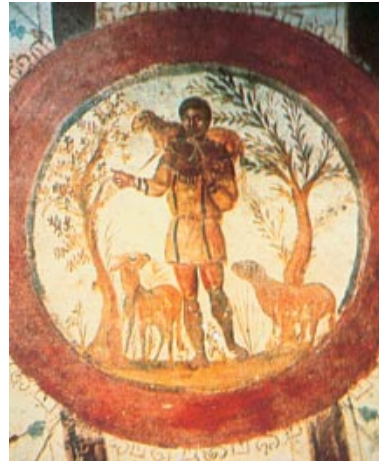
Jesucrist, bon pastor. Art paleocristià. Catacumbes (Roma)

Jesús les puso esta comparación, pero ellos no entendieron de qué les hablaba. Por eso añadió Jesús: «Os aseguro que yo soy la puerta de las ovejas. Todos los que han venido antes de mí son ladrones y bandidos; pero las ovejas no los escucharon. Yo soy la puerta: quien entre por mí se salvará y podrá entrar y salir, y encontrará pastos. El ladrón no entra sino para robar y matar y hacer estrago; yo he venido para que tengan vida y la tengan abundante.»