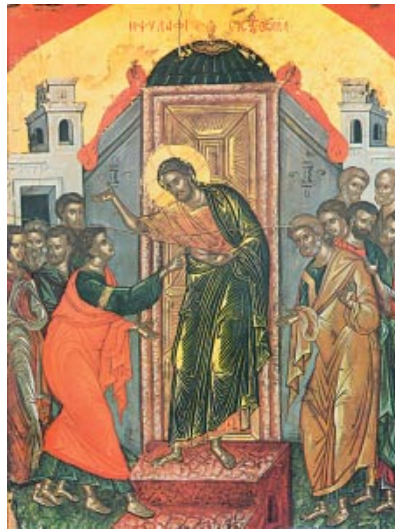
El dubte de Tomàs. Icona de Teòfanes el Grec (s. XVI), monestir de Stavronikita, Mont Athos

Muchos otros signos, que no están escritos en este libro, hizo Jesús a la vista de los discípulos. Éstos se han escrito para que creáis que Jesús es el Mesías, el Hijo de Dios, y para que, creyendo, tengáis vida en su nombre.