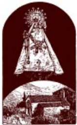
Santuari de Fussimanya, prop de Sallent, molt visitat per Anton M. Claret

E ls claretians, fundats durant la supressió dels ordes religiosos (1849), mentre durava el calvari i exili del seu fundador, s'anaven estenent i consolidant per les ciutats i pobles de Catalunya on, des de llur fundació, exercien fructuosament la predicació popular. Mossèn Cinto Verdaguer s'entusiasmà amb els sermons dels primers missionistes claretians per «aquella predicació tan catalana i senzilla, ardent i feridora», i per això, agraïdament, dedicà als claretians el llibretó de càntics missionals titulat Veus del Bon Pastor (Vic 1894).