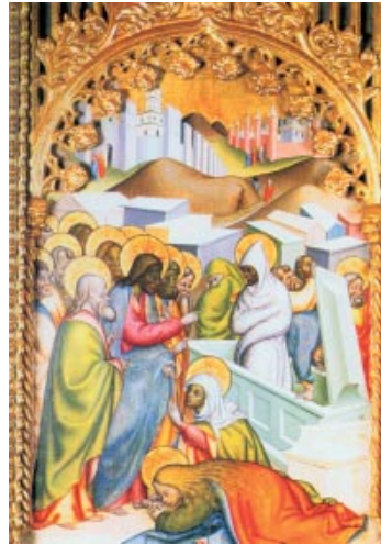
La resurrecció de Llätzer. Retaule de la Catedral Vella de Salamanca

Y muchos judíos que habían venido a casa de María, al ver lo que había hecho Jesús, creyeron en él.