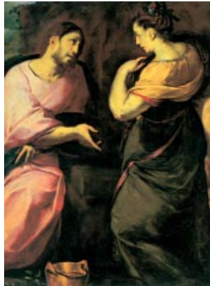
Jesús i la dona samaritana. Pintura intimista de Crespi, Catedral de Toledo

En aquel pueblo muchos creyeron en él. Así, cuando llegaron a verlo los samaritanos, le rogaban que se quedara con ellos. Y se quedó allí dos días. Todavía creyeron muchos más por su predicación, y decían a la mujer: «Ya no creemos por lo que tú dices; nosotros mismos lo hemos oído y sabemos que él es de verdad el Salvador del mundo».